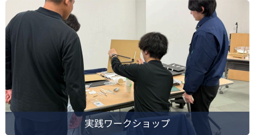
実践ワークショップ