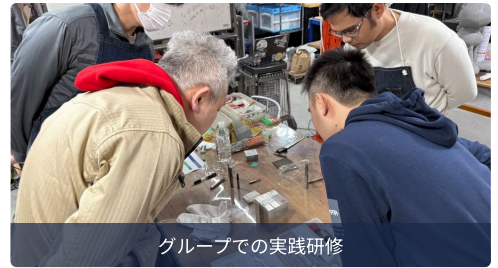
グループでの実践研修